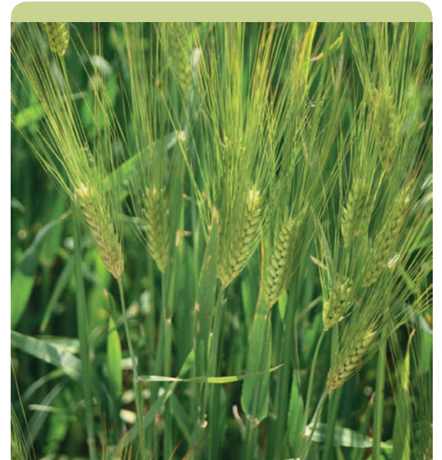
Semer trop tôt l'orge d'hiver peut avoir des effets néfastes : risques parasitaires et risques de gel des jeunes épis à la montaison.

L'orge 6 rangs 1/2 précoce KWS Tonic (Momom) confirme un très bon niveau de productivité. Elle se montre également assez résistante aux maladies foliaires et semble bien se comporter par rapport à la verse. Elle donne cependant des PS parfois un peu décevants.