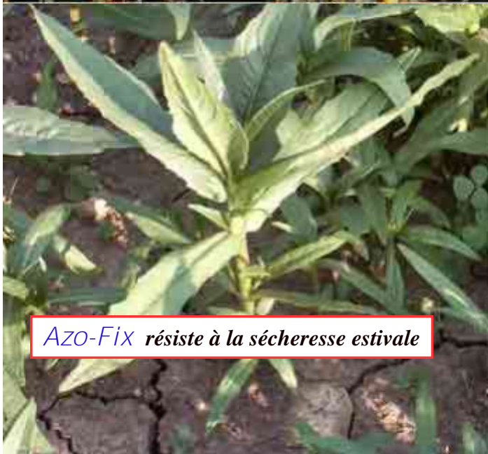
Azo-Fix résiste à la sécheresse estivale