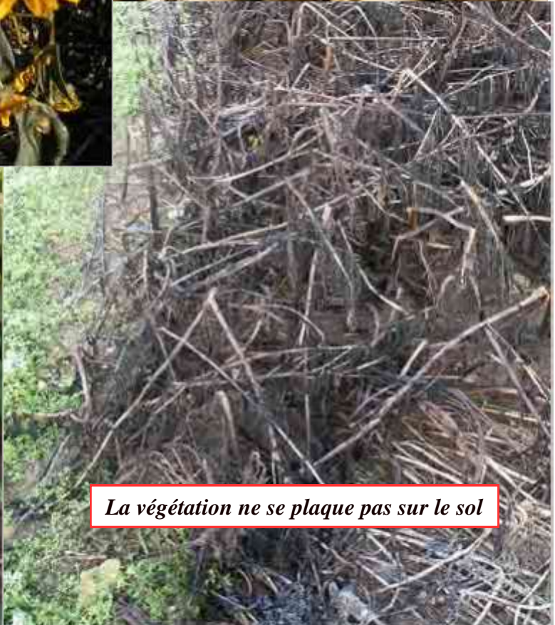
La végétation ne se plaque pas sur le sol