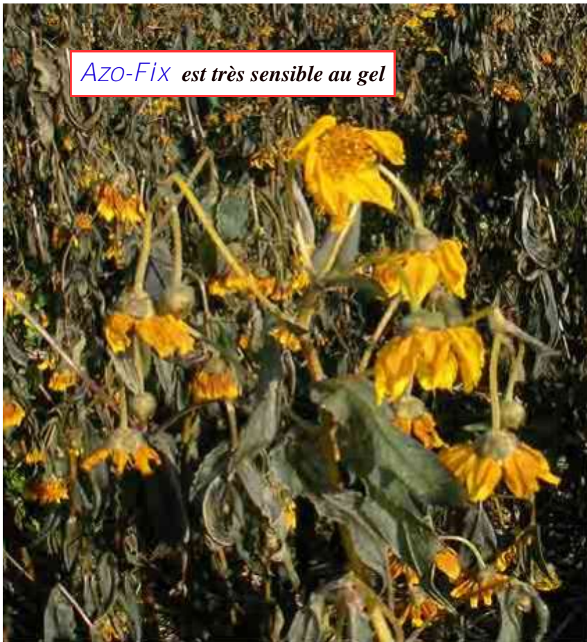
Azo-Fix est très sensible au gel