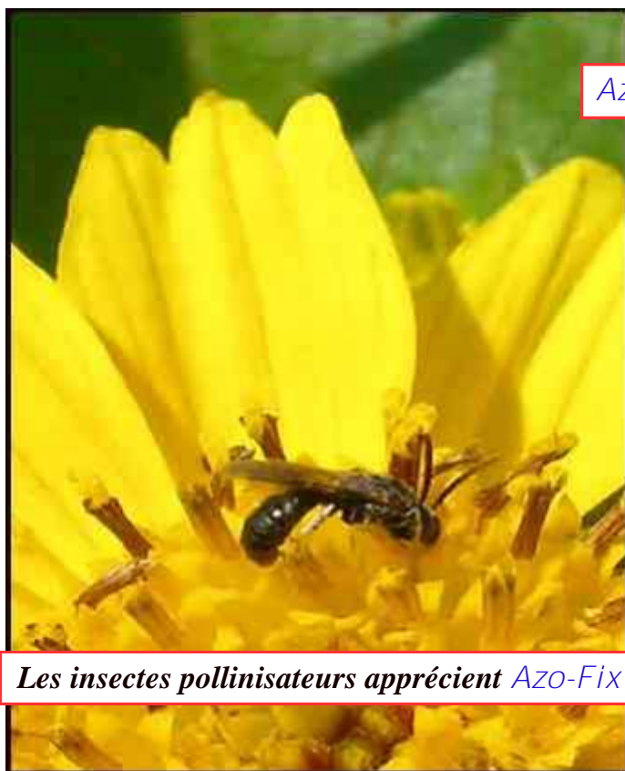
Les insectes pollinisateurs apprécient Azo-Fix