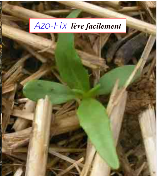
Azo-Fix lève facilement