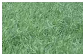
Alpiste des Canaries