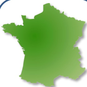
Zone de culture