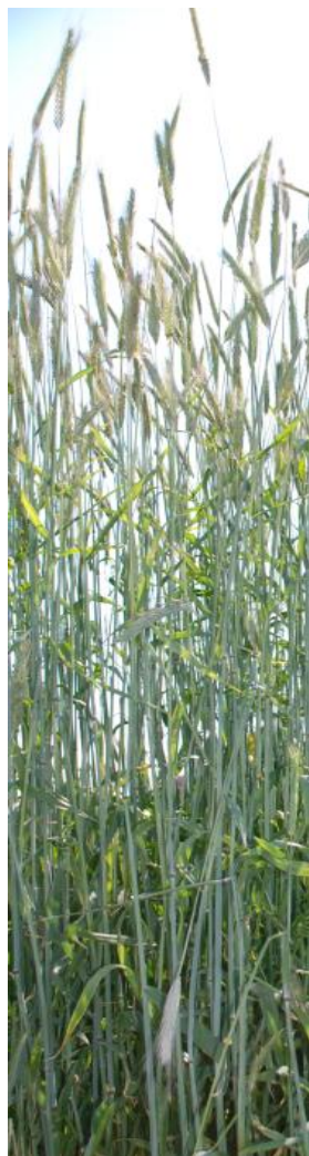
Fiche technique mise à jour : Aout 2015