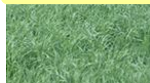
Alpiste des Canaries