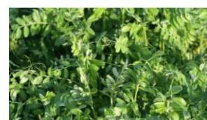
Vesce commune de printemps

Fiche technique mise à jour : janvier 2017